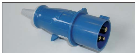
Typ CEE17 Farbe : Blau Kat. Nr. B11861

Empfohlene Stecker für 230 Volt Installation