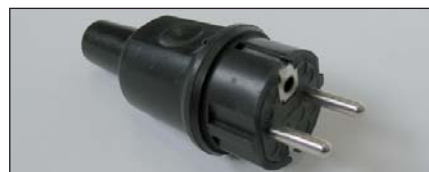
Schuko Vollgummistecker mit zusätzlicher Erdung Kat. Nr. B11619