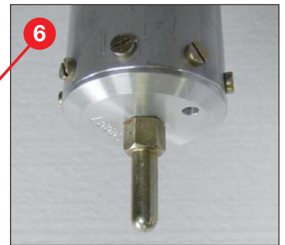
Zapfen am Mastfuss für schnelle und einfache Befestigung am Dreibeinstativ oder Fahrzeug-Anbauset