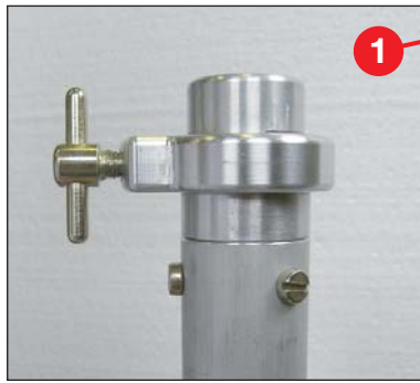
24 mm Klemmsystem