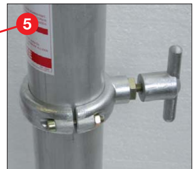
Knebschraube für schnelle und einfache Befestigung am Dreibeinstativ oder Fahrzeug-Anbauset